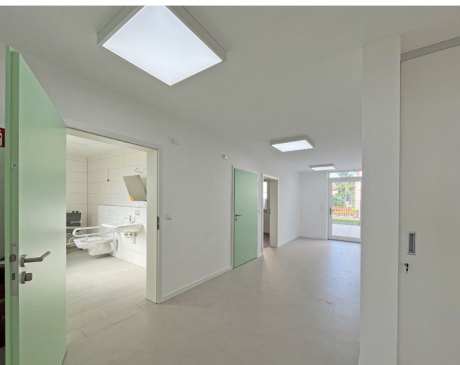
Bad (offen), Bad (geschlossen), Zimmer 2, Blick auf die Terrasse

Ein professionelles Pflege- und Betreuungsteam sorgt in enger Zusammenarbeit mit den Angehörigen für eine bestmögliche individuelle Förderung mit ständig angepasster Pflege und gleichzeitiger Gewährleistung größtmöglicher Selbstversorgung .