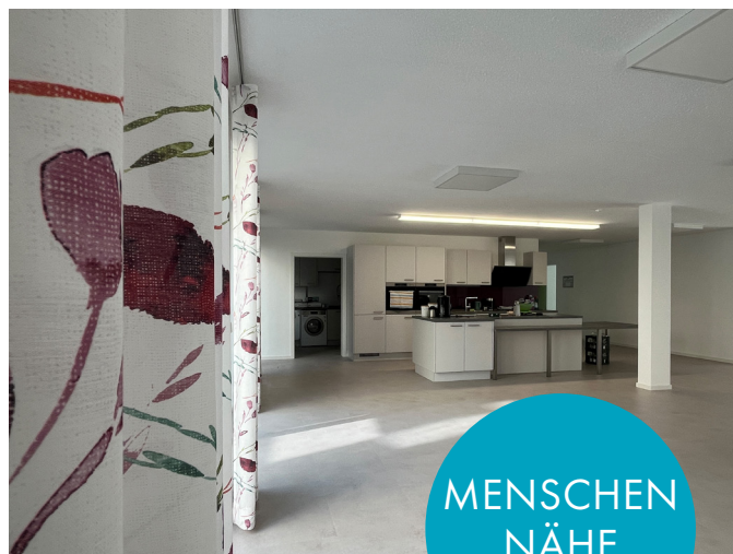
Gestaltung/Foto: Götz Schwarzkopf

Eine zentrale Rolle dabei spielen die professionellen Alltagsbegleiterinnen und -begleiter, die rund um die Uhr in der Wohngemeinschaft präsent sind. Sie übernehmen die Grundpflege, die soziale Betreuung, unterstützen – wo nötig – bei der Hauswirtschaft und sorgen für eine Einbindung und Förderung der Bewohnerinnen und Bewohner.