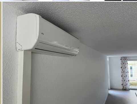
Klimatisierter Wohn- & Aufenthaltsbereich