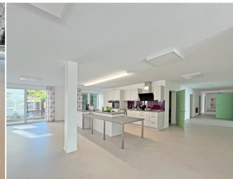
Wohn- & Küchenbereich mit Gang in Richtung Zimmer 5 bis 12